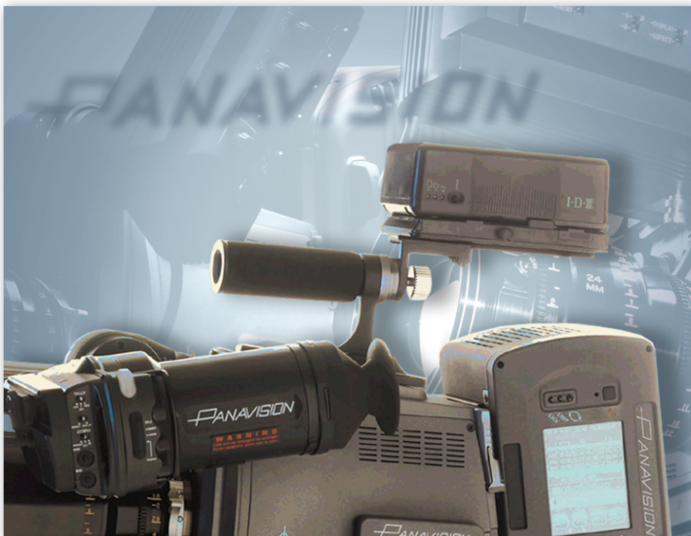
Adaptateur de batteries monté sur une caméra Genesis ®